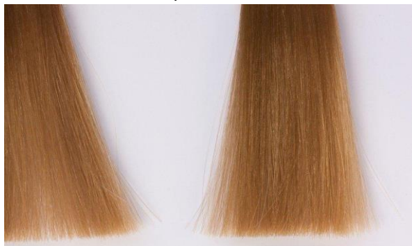
Slika 3. Pramen kose